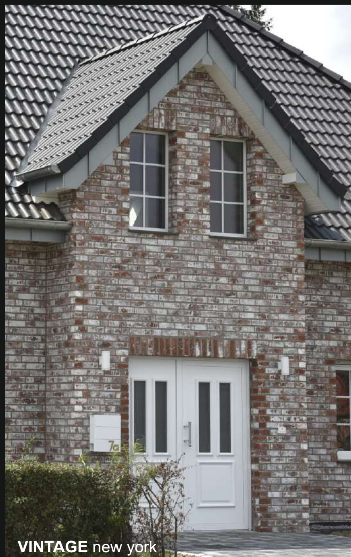
VINTAGE new york

VINTAGE-Klinkerriemchen weisen serienmäßig Bruchkanten und Unregelmäßigkeiten in der Oberfläche auf. Wie bei echten Bruchsteinen befinden sich in den Kartons nicht nur ganze Riemchen, sondern auch Teilstücke. Dies ist beabsichtigt und dient dazu, ein lebendiges Mauerwerk mit dem Charme einer freigelegten Backsteinwand in der Tradition des „Industrial Chic“ herzustellen.