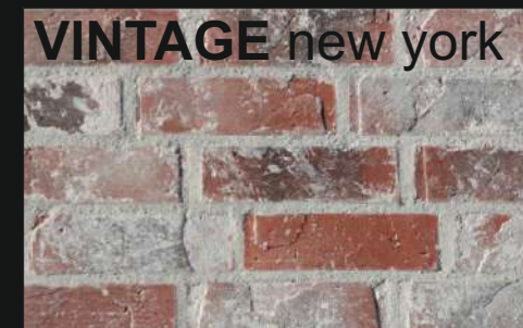
VINTAGE new york