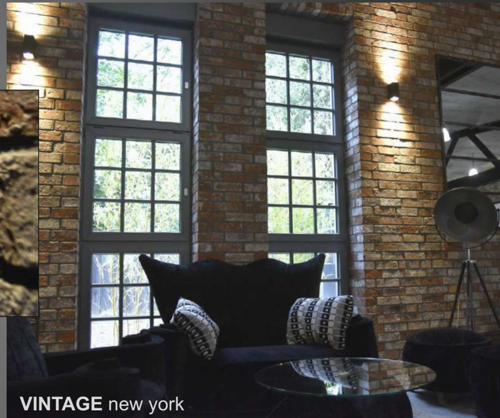
VINTAGE new york