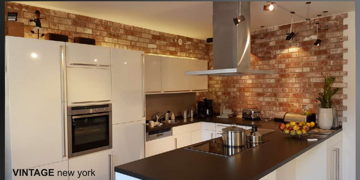
VINTAGE new york